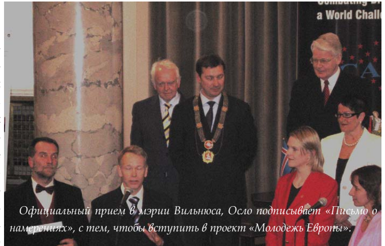
Официальный прием в мэрии Вильнюса, Осло подписывает «Письмо о намерениях», с тем, чтобы вступить в проект «Молодежь Европы».

нции прошел для гостей в посещениях Дневного Центра групп риска для девочек, клиники социальной помощи "Деметра" и в панорамных поездках по Вильнюсу и в Тракай.