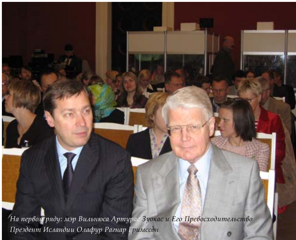
На первом ряду: мэр Вильнюса Артурас Зуокас и Его Превосходительство Президент Исландии Олафур Рагнар Гримссон

Удачные годовые конференции в ECAD стали уже доброй традицией, и Конференция Мэров городов 2006 года, прошедшая в Вильнюсе, - не исключение. В этом году приехавшие делегаты работали 2 дня, 1 и 2 июня, конференции также предшествовало внутреннее заседание Правления ECAD.