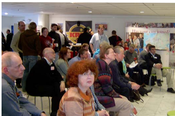
Scenen "Folkrörelser mot droger", Sverige Mot Narkotika, Västerås

Konferensen i Europaparlamentet, "Internationella dimensioner av europeisk narkotikapolitik" som ECAD organiserade tillsammans med EU-parlamentarikern Charlotte Cederschiöld och Global Institute on Drug Policy gav gensvar bland ECAD:s medlemmar, olika europeiska organisationer och i USA.