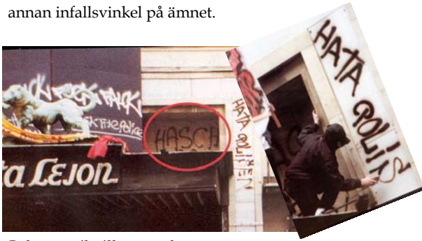
Boken är rikt illustrerad