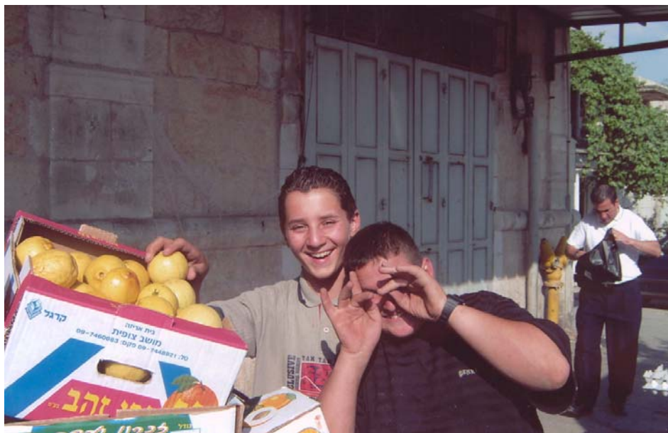
Молодежь в Иерусалиме