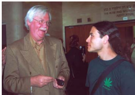
Ханк Райтер и молодой пропагандист

предоставленным организаторами, в Израиле насчитывается около 25 000 наркозависимых (население страны составляет 7 миллионов). Около 80% заключенных в израильских тюрьмах были осуждены за преступления, связанные с наркотиками. Потребление наркотиков молодежью значительно возросло за последние 6-7 лет. Появился и новый тревожащий фактор: распространение наркомании среди русскоязычных эмигрантов. Всего за прошедшие 10 лет около одного миллиона новых граждан Израиля прибыли из стран бывшего Советского Союза.